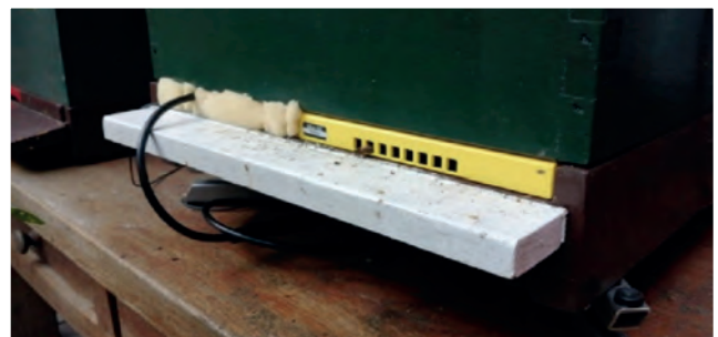
Bijenkast op een weegschaal met de teller op de vliegplank.

• In het kader van het onderzoek naar voedselconcurrentie wordt op een van de volken op het nieuwe park nog steeds met het Beep registratiesysteem de temperatuur in het broednest, het geluid en het gewicht bijgehouden. Daar is nu ook een teller in het vliegpat bijgekomen. Daarmee wordt het aantal uitgaande en binnenkomende bijen geregistreerd. Zo kun je thuis vanaf de bank zien hoe actief jouw bijen op het park zijn. Een leuk hulpmiddel.