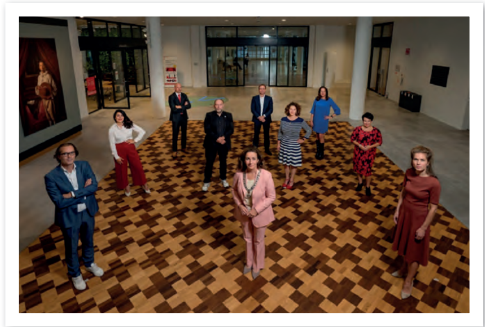
Het Amsterdams College van B en W

Wie schets mijn verbazing toen ik een tijdje terug in de krant las dat de gemeente Amsterdam van plan is om de huur van de volkstuinjes met 500%, ja u leest het goed met 500%, te verhogen. En het gaat niet over een paar tuintjes maar 8.000 stuks verspreid over 40 parken. Ik kon mijn ogen niet geloven. Amsterdam heeft sinds de zomer van 2018, zoals dat heet, een 'links' college van B en W.