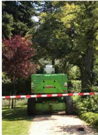
Hoogwerker op het pad