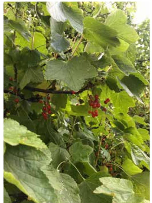
Enfin, de vogels hebben nog wel iets laten hangen.