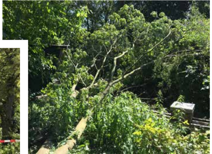
In de tuin van Hugo