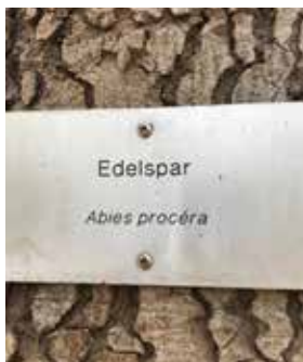
Ravage van de Edelspar

Met dank aan Aleid en Gerrit