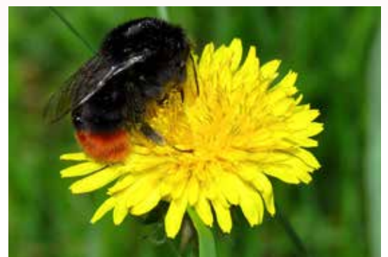
Voorbeeld steenhommel