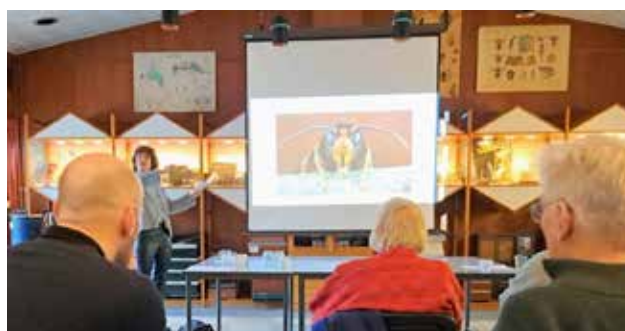
Foto's van de bijeenkomst over de Aziatische hoornaar, door Danielle Kars