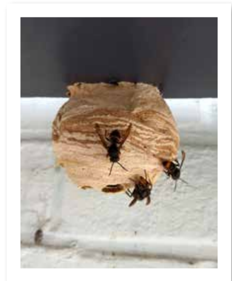
Primair nestje onder de dakgoot.

Bij deze aanpak mag je verwachten dat de hoornaar populatie onbeperkt zal doorgroeien en er al heel snel een serieuze bedreiging voor onze bijen en ook de biodiversiteit zal optreden.