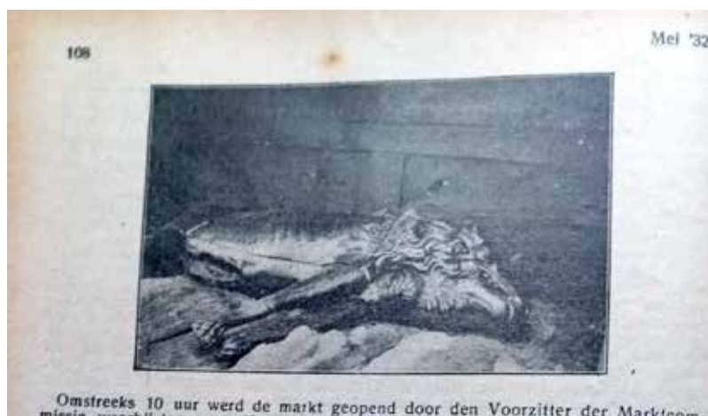
Afbeelding in 'het Groentje' van mei 1932

De onbekende herkomst kan met het artikel uit 1932 wel met enige zeker- heid vastgesteld worden. De genoemde restauratiedatum lijkt niet erg waar- schijnlijk. Waarom en wanneer het object als preekstoel verder ging is nog een raadsel.